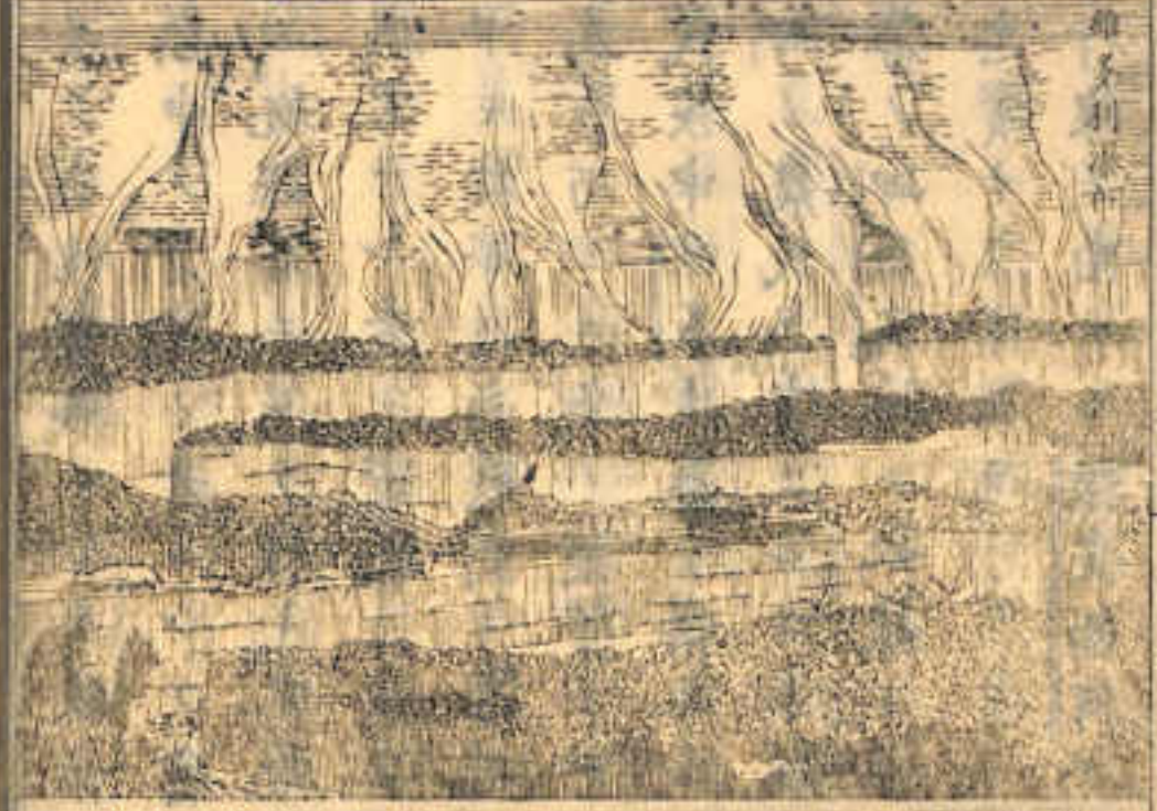
此處ニ 探訪セ シ地方

魚數ノ津流ニ浴ヒタ ル廣漠ノ地方ハ二十 餘年前マテ世人ノ絶 エテ探リ知ラザル所 ナリレガ英國ノ高名 ナル旅行家リ井ンク ストン氏危險ヲ侵シ テ跋涉セシニ依リ比 朱亞馬哥羅巴倫他等 ノ地理略記スベレ其 ノ地勢岡陵處々ニ起