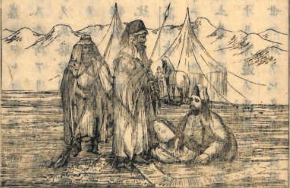
亞刺比亞人ノ風俗

シ盡キ。河道ハ別ニ人 民内地ニ往來スルノ 通路トナルト云フ。故 ニ物産亦自他國ニ 異ナリ。西南部谷間ノ 地ハ穀物ヲ産セザル ニアラザレドモ。人民 主トモテ此ノ國ニ蕃 茂スル黍ノ實ヲ食セ。 貧民ハ蝨斯ヲ食ス。國 ノ西南部ヨリハ良好