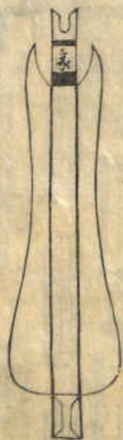
此通ヨリ下羽ヨト云